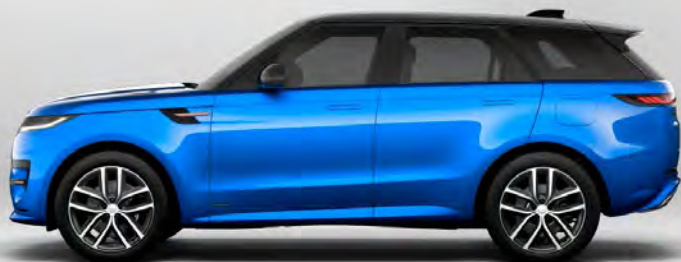
ULTRA METALLIC VELOCITY BLUE HOOGGLANS OF SATIJNGLANS