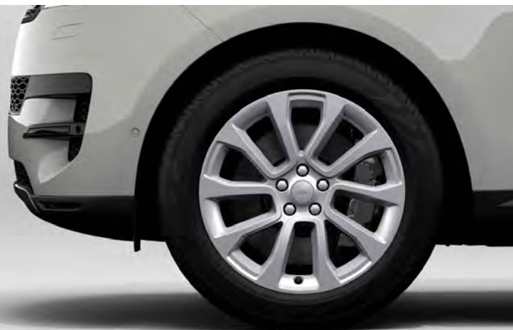
21" 'STYLE 5126' GLOSS SPARKLE SILVER Standaard op Range Rover Sport SE