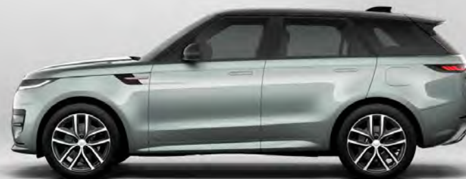
ULTRA METALLIC IONIAN SILVER HOOGGLANS OF SATIJNGLANS