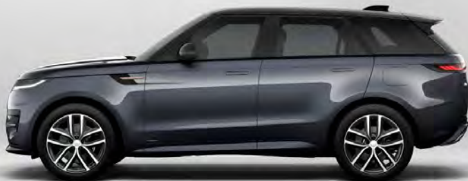
ULTRA METALLIC AMETHYST GREY-PURPLE HOOGGLANS