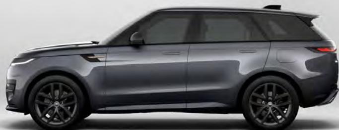
METALLIC VARESINE BLUE