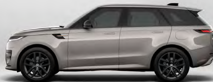
METALLIC BORASCO GREY