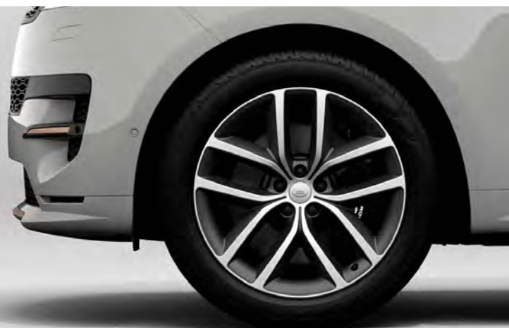
22" SV BESPOKE 'STYLE 5127' DIAMOND TURNED FINISH & CONTRAST SATIN DARK GREY Standaard op Range Rover Sport Autobiography