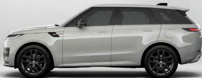
SOLID FUJI WHITE