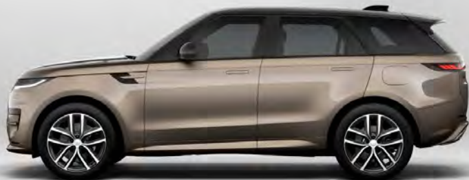
ULTRA METALLIC SUNSET GOLD HOOGGLANS OF SATIJNGLANS