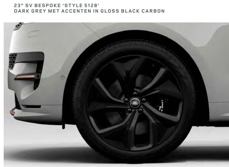
23" SV BESPOKE 'STYLE 5128' DARK GREY MET ACCENTEN IN GLOSS BLACK CARBON