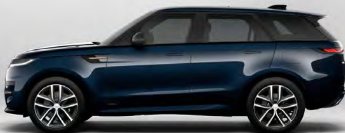
ULTRA METALLIC CONSTELLATION BLUE HOOGGLANS