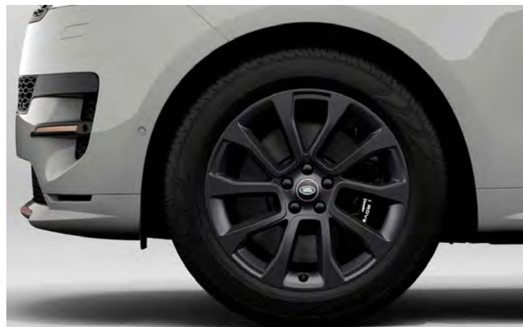
21" 'STYLE 5126' SATIN DARK GREY Standaard op Range Rover Sport Dynamic SE