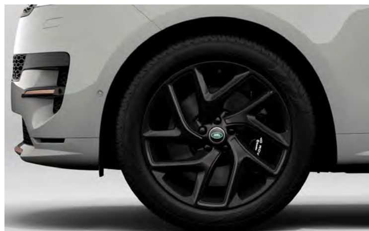
22" SV BESPOKE 'STYLE 5131' SATIN BLACK & CONTRAST GLOSS BLACK