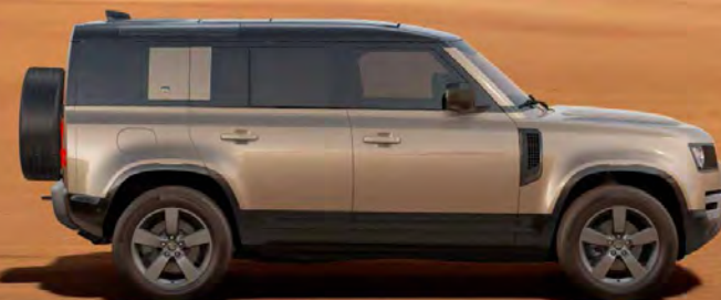
METALLIC GONDWANA STONE