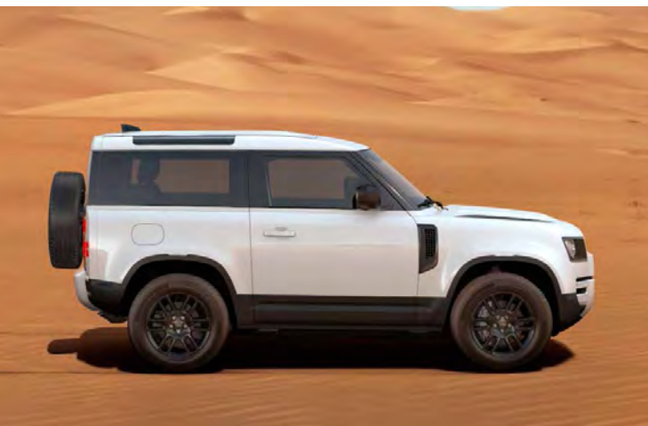
19" 'STYLE 6010' GLOSS BLACK