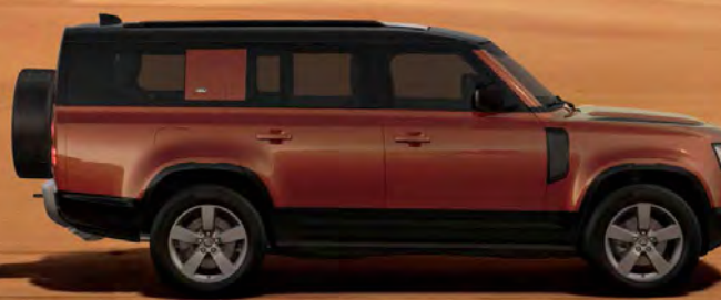
METALLIC SEDONA RED ALLEEN VOOR 130 EN 110 SEDONA EDITION