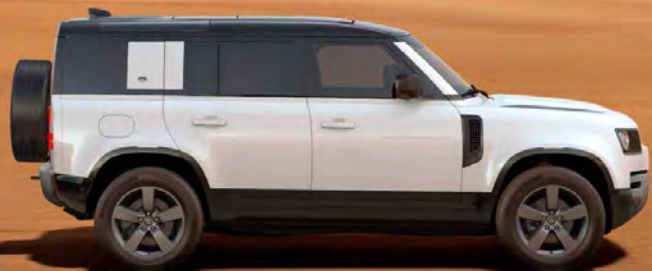
SOLID FUJI WHITE