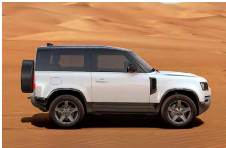
20" 'STYLE 5094' SATIN DARK GREY Standaard op Defender X-Dynamic SE

Er is keuze uit een uitgebreid programma lichtmetalen velgen. De maten variëren van 18" tot een bijzonder aantrekkelijke 22". De markante designkenmerken voegen stuk voor stuk hun specifieke karakter toe aan de uitstraling van de auto. In de configurator op landover.be kunt u zien welke velgen beschikbaar zijn voor uw gewenste uitvoering.