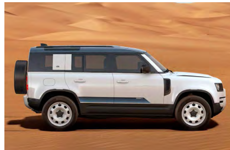
20" 'STYLE 9013' GLOSS WHITE Alleen i.c.m. County Exterior Pack