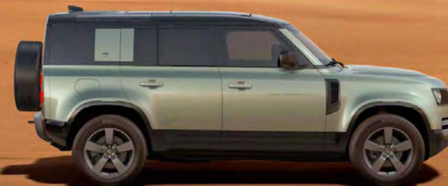
METALLIC PANGEA GREEN