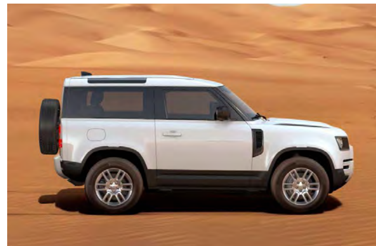
19" 'STYLE 6010' GLOSS SPARKLE SILVER Standaard op Defender S