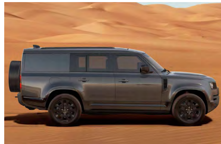
20" 'STYLE 5095' GLOSS BLACK Standaard op Defender 130 Outbound