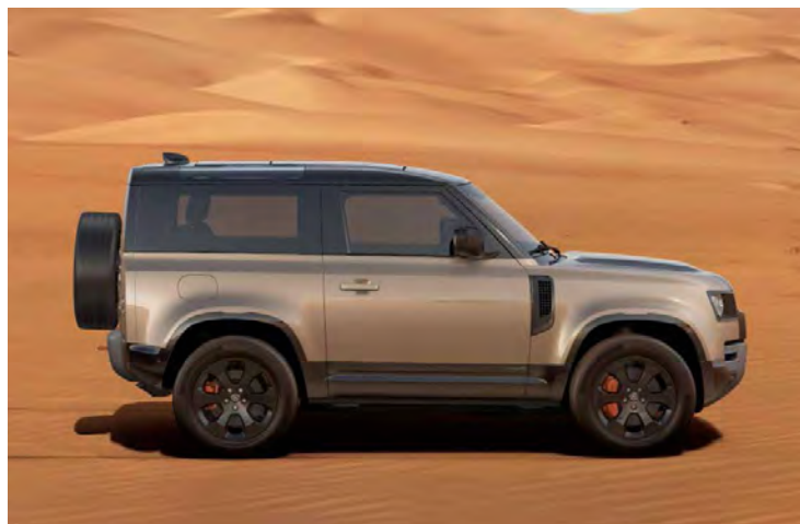
20" 'STYLE 6011' GLOSS BLACK

Er is keuze uit een uitgebreid programma lichtmetalen velgen. De maten variëren van 18" tot een bijzonder aantrekkelijke 22". De markante designkenmerken voegen stuk voor stuk hun specifieke karakter toe aan de uitstraling van de auto. In de configurator op landover.be kunt u zien welke velgen beschikbaar zijn voor uw gewenste uitvoering.