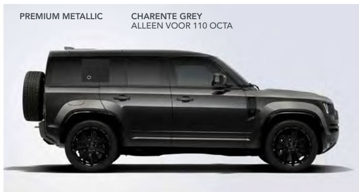
PREMIUM METALLIC CHARENTE GREY ALLEEN VOOR 110 OCTA