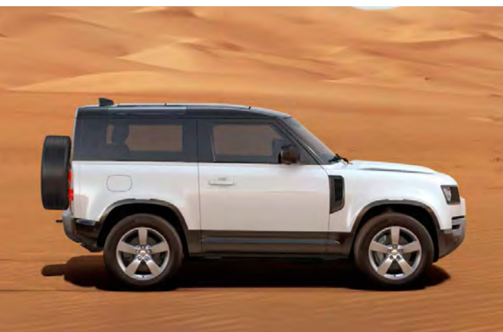
20" 'STYLE 5098' GLOSS SPARKLE SILVER