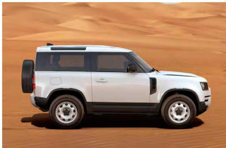
18" STAAL 'STYLE 5093' GLOSS WHITE

Er is keuze uit een uitgebreid programma lichtmetalen velgen. De maten variëren van 18" tot een bijzonder aantrekkelijke 22". De markante designkenmerken voegen stuk voor stuk hun specifieke karakter toe aan de uitstraling van de auto. In de configurator op landover.be kunt u zien welke velgen beschikbaar zijn voor uw gewenste uitvoering.