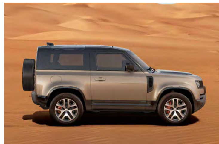
20" 'STYLE 5095' GLOSS DARK GREY & CONTRAST DIAMOND TURNED FINISH